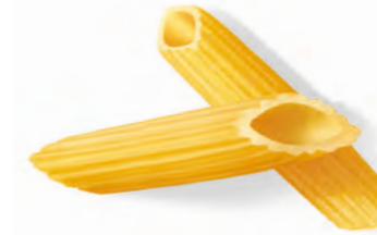
36 PENNE MEDIE RIGATE 500g