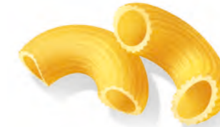
40 STORTINI RIGATI 500g