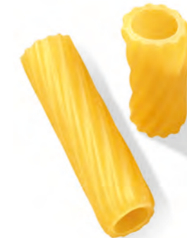
49 TORTIGLIONI 500g