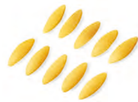
17 RISONE 500g