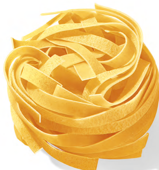
74 FETTUCCINE 500g