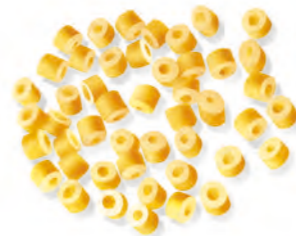
18 CORALLINI 500g