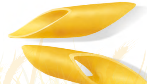
66 PENNE LIGURI 500g