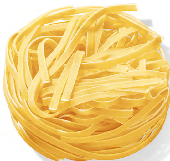
73 TAGLIATELLE 500g