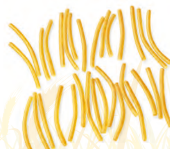
35 FILINI 500g