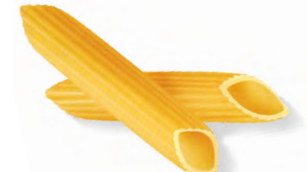
45 PENNE RIGATE 500/1000g