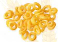
21 ANELLINI 500g