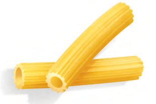
37 SEDANINI RIGATI 500g