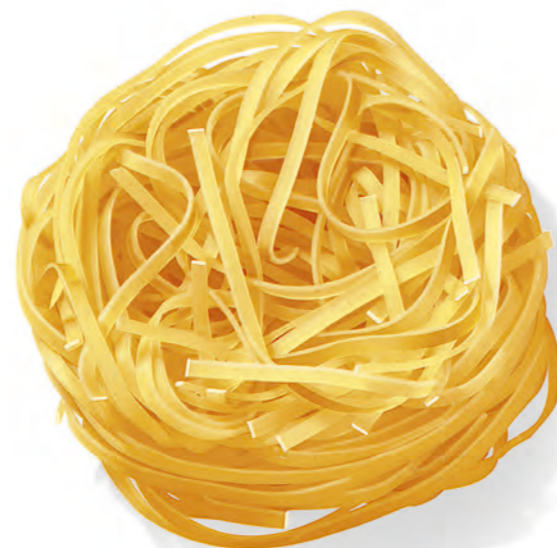
72 TAGLIERINI 500g