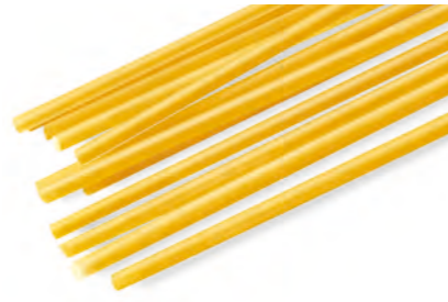
7 VERMICELLINI 500g