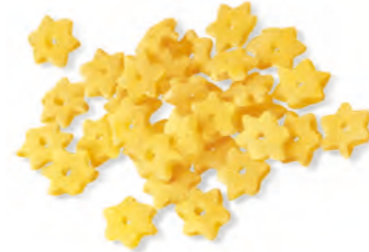
20 STELLINE 500g