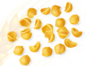
22 CONCHIGLIETTE 500g