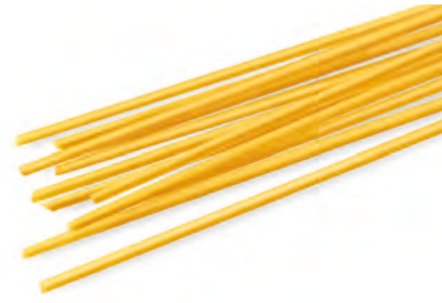
3 SPAGHETTINI 500g