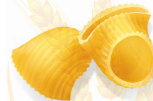
52 LUMACHINE RIGATE 500g