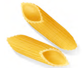
41 MEZZE PENNE RIGATE 500/1000g