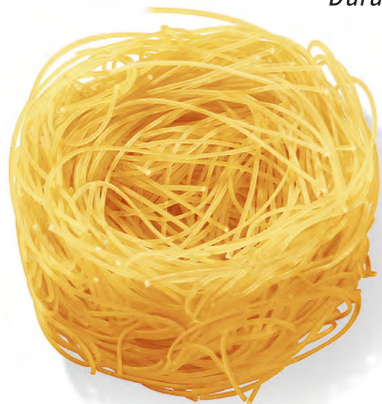
70 CAPELVENERE 500g