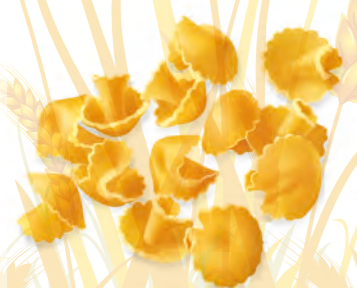
29 CAPPELLETTI 500g