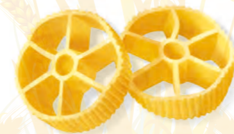
61 RUOTE 500g