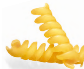
47 TRIVELLINE 500/1000g