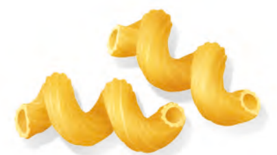
51 CELLENTANI 500g