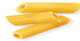
25 PENNETTE RIGATE 500g