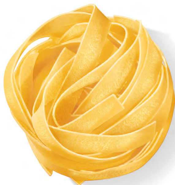
75 LASAGNETTE 500g

SGAMBARO S.p.A. Via Chioggia 11/A – 31030 Castello di Godego (TV) Tel. +39 0423 760007 Fax. +39 0423 760101