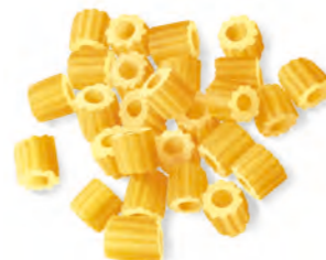
24 GARIBALDINI 500g