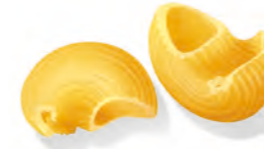
43 PIPE RIGATE 500g