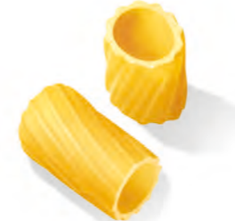
39 NOCCIOLINE 500g