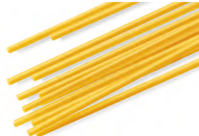
5 SPAGHETTI 500/1000g