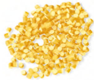
13 TEMPESTINA 500g