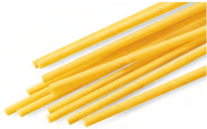
8 VERMICELLI 500g