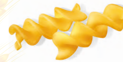
56 ELICHE 500g