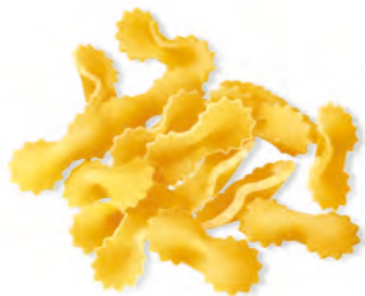
28 FARFALLINE 500g