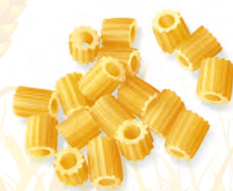
32 CORALLINI RIGATI 500g