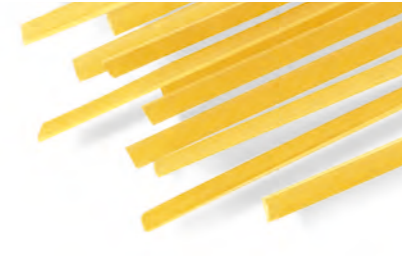
10 TRENETTE 500g