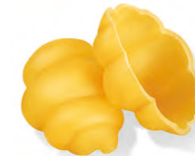
44 GNOCCHI 500g